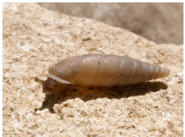
D'autres favorisent les rochers ou les vieux murs (ici la perlée des murailles Papillifera solida )