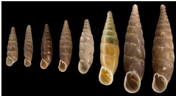
Quelques-unes des 47 clausilies présentes en France. Remarquer la forme caractéristique de la coquille.

Identification : Coquille de taille petite à moyenne, très allongée, toujours sénestre (ouverture à gauche). Forme de quille pour les grandes espèces, d'aiguille pour les petites. Brun sombre à ocre clair, parfois blanche. Ouverture petite et garnie de dents.