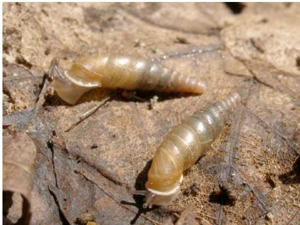
On distingue par transparence les lamelles internes de la coquille.