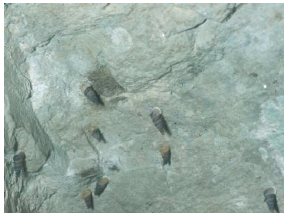
Les cochlostomes se rassemblent parfois en nombre sur les rochers calcaires.