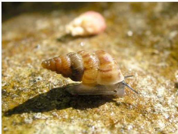
Le cochlostome commun Cochlostoma septemspirale est le plus répandu des cochlostomes en France. Il vit plutôt dans les endroits humides sur le sol, par exemple sous les pierres ou le bois mort.