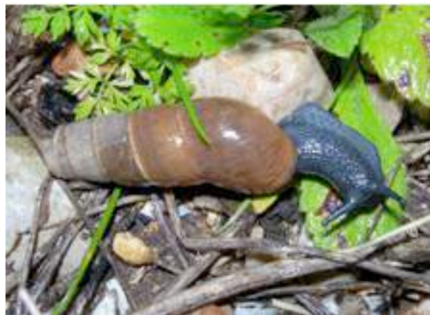
Coquille d'adulte à gauche, de jeune à droite.