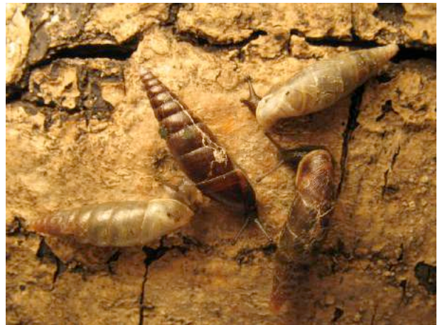
Remarquer la variation de la couleur de la coquille, qui n'est donc pas un critère suffisant pour l'identification.