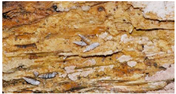
Certaines espèces se rencontrent en nombre sur le bois mort.