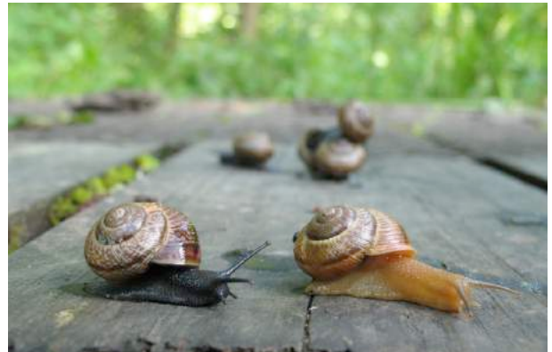
La couleur du corps peut varier du noir au brun clair au sein d'une même population.