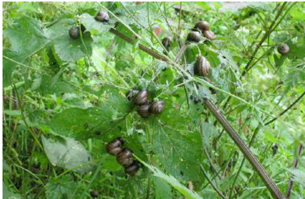
Rassemblement d'hélices des bois sur la végétation basse dans une zone humide.