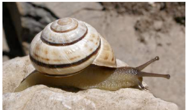
Escargot des forêts