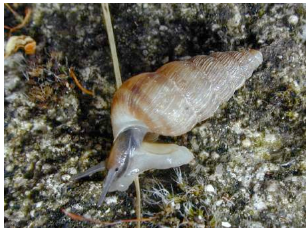
Remarquer l'opercule sur l'arrière du pied et les yeux à la base des tentacules.