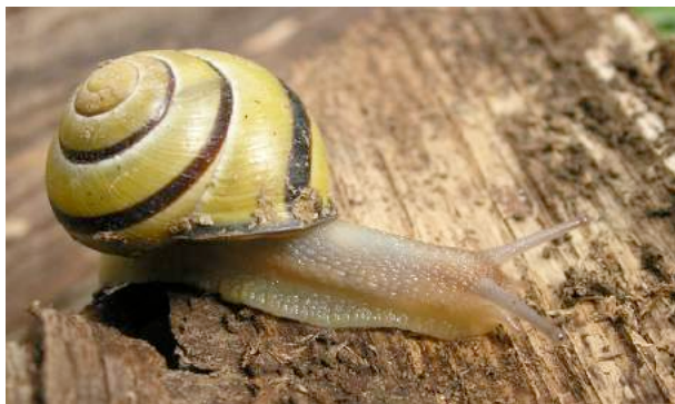
Escargot des haies typique

Ces trois espèces présentent une grande variété de coloration des coquilles, même au sein d'une seule population : tous les individus de la photo de droite ont été collectés sur quelques dizaines de mètres carrés.