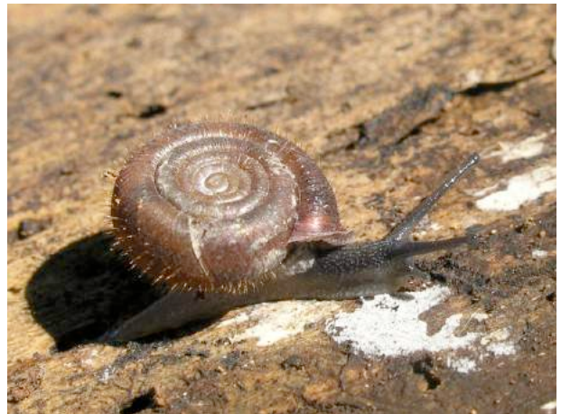
Remarquer les poils sur la coquille