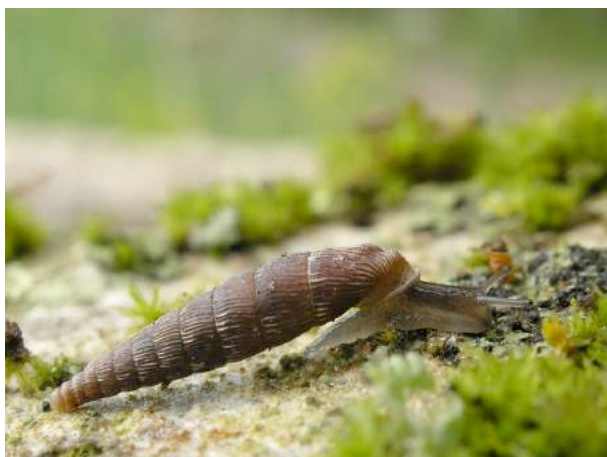
Les lieux moussus et humides sont recherchés par certaines espèces de clausilies, ici la clausilie allongée ( Clausilia bidentata crenulata ).