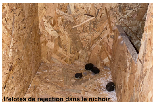
Pelotes de réjection dans le nichoir

Cerise sur le gâteau, 15 jours après l'installation des nichoirs, ces derniers ont été visités, marquant ainsi un premier succès pour la conservation de cette espèce.