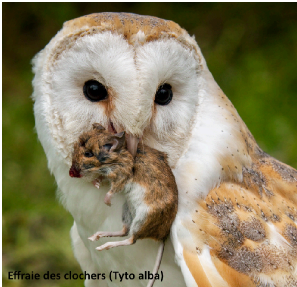
Effraie des clochers (Tyto alba)