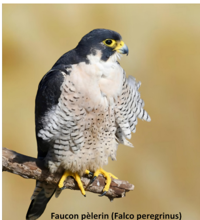
Faucon pèlerin ( Falco peregrinus )