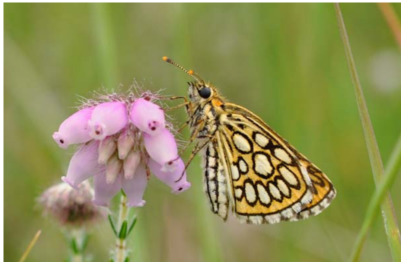
Miroir (Heteropterus morpheus)

Le Miroir, au vol sautillant est l'un des papillons de nos contrées les plus élégants. En déclin en Europe, il est sur notre territoire, très localisé, dans les zones herbeuses des coteaux auscitains.