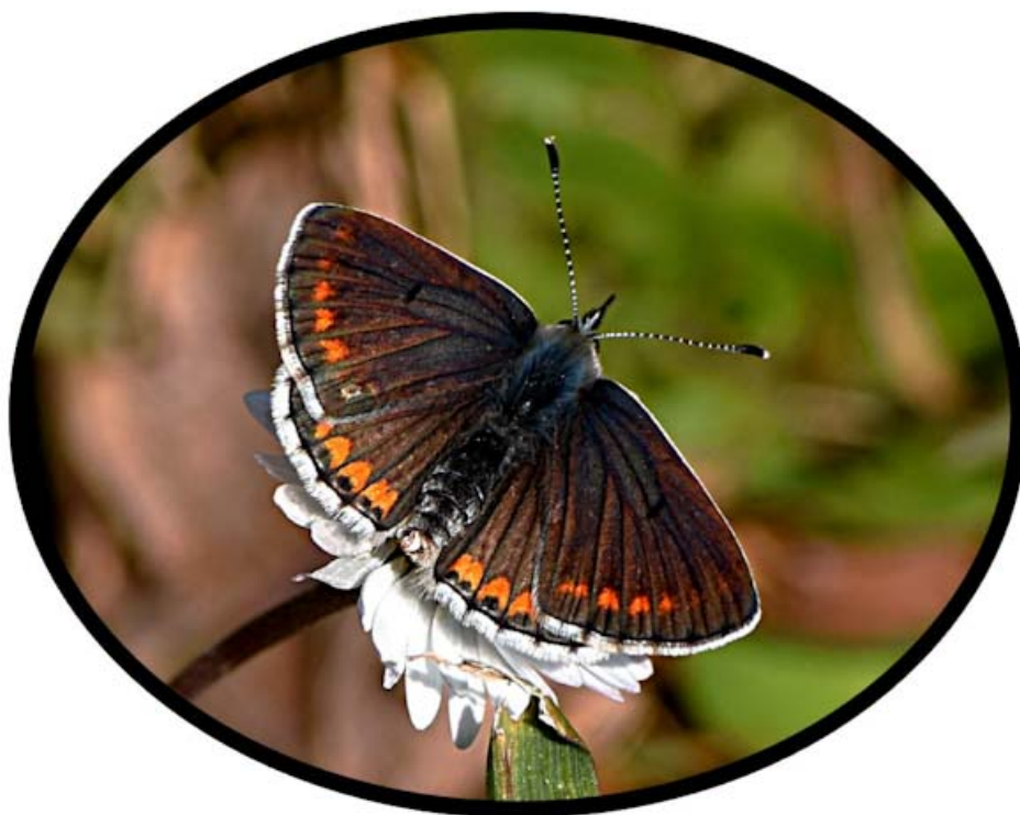
Collier de corail (Aricia agestis)