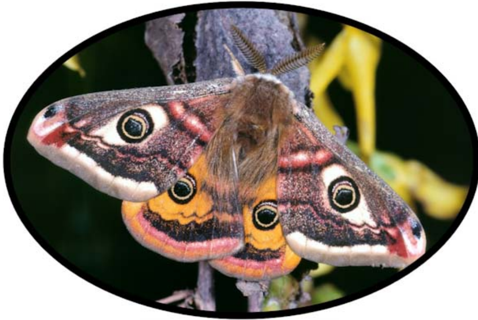
Petit Paon de Nuit ( Saturnia pavonia )

Les antennes de papillon de nuit sont généralement filiformes, plumeuses ou encore larges.