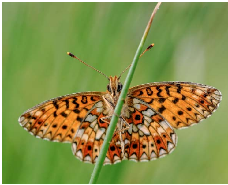
Petit Collier argenté (Boloria_selene)