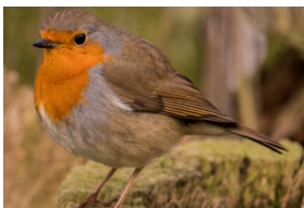
Rouge gorge familier